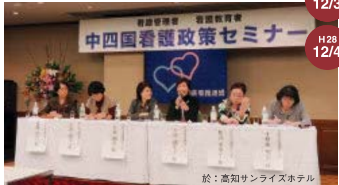
於：高知サンライズホテル