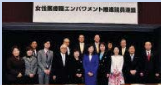
←議連役員の先生方と

「女性医療職エンパワメント推進議員連盟」が1月27日に設立総会を開催しました。女性医療職の更なる活躍を支えるために医療職特有の働き方とそれに伴う健康問題に着目した手厚い対応策及びイベントへの対応とキャリア形成との均衡をはかり、就業継続できる社会政策の整備に取り組みます。