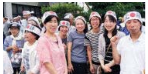
集会等の活動も明るく元気よく！

また看護部や会員との繋がりも強く、いろいろな活動に協力してもらえ本当に助かっています。今後も役員一同支部全体のまとまりを大事にしながら、納得できる結果を出すために頑張ります。