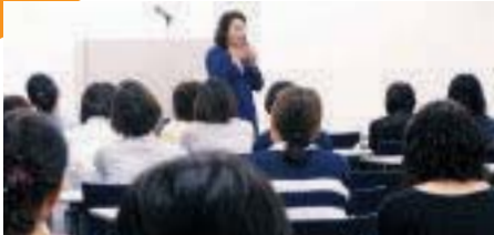
看護協会研修受講者に挨拶