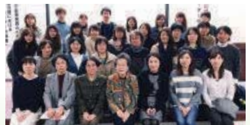
リーダーセミナー参加者（H28.11.17）