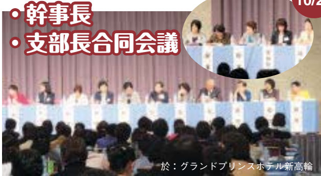
於：グランドプリンスホテル新高輪