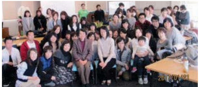
支部新人研修会参加者と支部役員（H29.1.21）