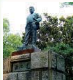
中央公園 菊池寛像