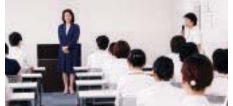
施設訪問（高松赤十字病院）