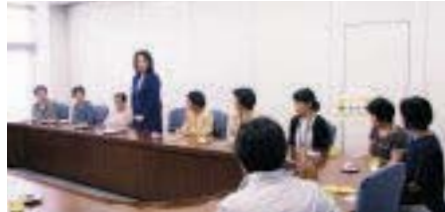
看護協会役員・看護連盟役員 ・支部長との懇談会