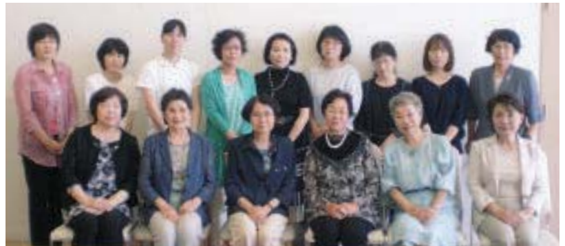
平成28年度連盟第2支部集会 地域の支援者と支部役員（H28.6.26）