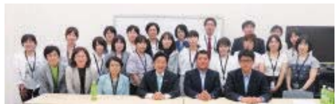
地元選出議員と交流