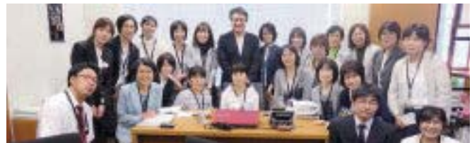
参議院会館 石田事務所と石田まさひろ議員と