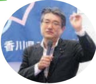
特別講演 石田まさひろ参議院議員