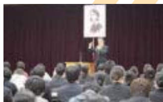
四国医療専門学校