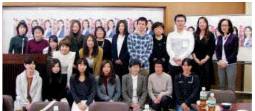
支部新人研修会参加者と支部役員（H27.12.12）