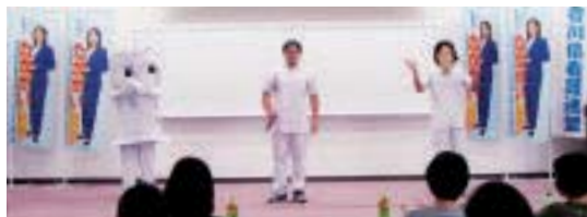
青年部の応援パフォーマンス