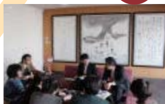
守里会看護福祉専門学校